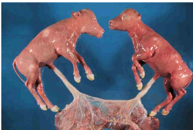
Figura 1. Anastomosis vascular placentaria de fetos bovinos.

Una ternera freemartin es una hembra concebida en una gestación múltiple ( v. gr. , gemelos, triates, etc.) con un macho. Como consecuencia de este tipo de gestación, en más del 90% de ocasiones se establece una comunicación de vasos sanguíneos entre las placentas de los fetos gemelos entre los 30 y 40 días de gestación (Fig. 1), originando un intercambio de células (quimerismo hematopoyético) y sustancias plasmáticas como hormonas, que conllevan al nacimiento de una ternera estéril e intersexual (freemartin).